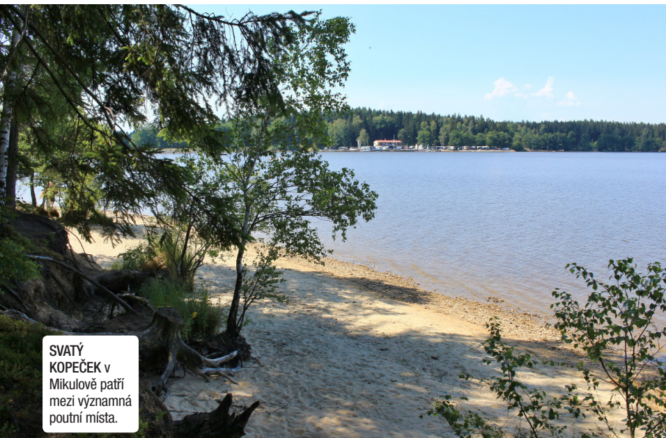
SVATÝ KOPEČEK v Mikulově patří mezi významná poutní místa.