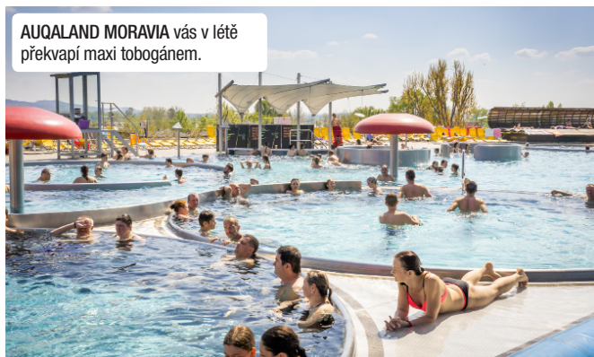
AQUALAND MORAVIA vás v létě překvapí maxi tobogánem.

❖ Do Pasohlávek se dostanete nejen autem, doveze vás sem autobus třeba z Mikulova. V tomto kouzelném moravském městě se ale určitě zdržíte.