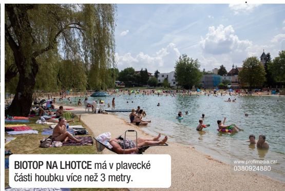
BIOTOP NA LHOTCE má v plavecké části houbku více než 3 metry.