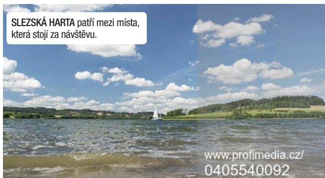
SLEZSKÁ HARTA patří mezi místa, která stojí za návštěvu.