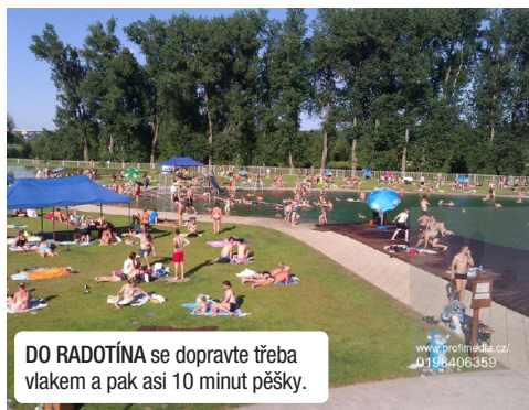
DO RADOTÍNA se dopravte třeba vlakem a pak asi 10 minut pěšky.

V hlavním městě najdete nespočet míst na koupání. Pokud ale chcete pobýt na čerstvém vzduchu a ještě byste uvítali čištění vody bez chemie, zamířte do Radotína nebo na Lhotku. Biotop v Radotíně na Praze 5 je v provozu od roku 1914, na Lhotce na Praze 4 se otevřel před dvěma lety. Od běžných koupališť se biotopy liší tím, že se skládají z koupací a čistící části se speciálními vodními rostlinami a mikroorganismy.