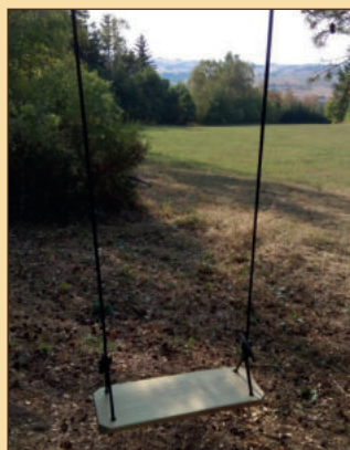
Houpačky (13, 22 a na Holém vrchu)