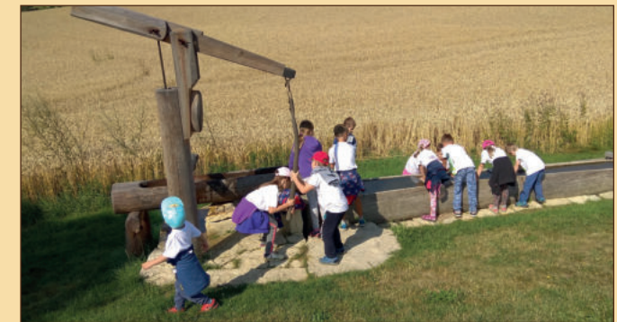
Historická dřevěná pumpa (6)

Více informací na: https://www.bory.cz/cs/naucna-stezka