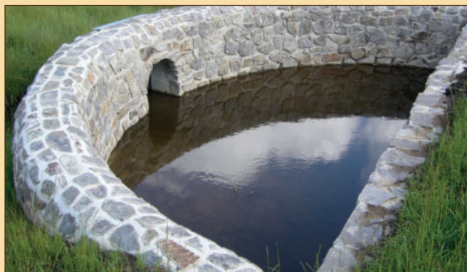
Poldr - protipovodňová opatření (16)

Naučnou stezku doplňují informační tabule na čekárně autobusové zastávky v místní části Cyrilov (O Cyrilově a Příroda Cyrilova). Informační panely jsou také u Přírodních památek Rasuven (Starý bukový les) a Mrázkova louka (Rašelinná louka s chráněnými druhy rostlin a živočichů).