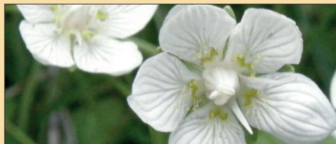
Tolije bahenní (16)

Různorodá krajina kolem Borů nabízí zajímavé vycházky a kopce u Cyrilova daleký rozhled. Nachází se zde Přírodní památky Mrázkova louka a Rasuveň a památné stromy. Okolí obce je světoznámou mineralogickou lokalitou, kam sběratelé přicházejí např. kvůli záhnědám, turmalínům či růženinům. Kolem obce se snadno setkáme se zvěří, lze tu houbařit, koupat se, nebo věnovat sportovnímu rybolovu. Vede tudy žlutá a červená turistická značka a cyklotrasa. Pro vzdálenější návštěvníky je připravena turistická ubytovna.