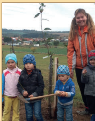
Společně vysazené stromy už dávají ovoce (11)

Autorem textů a většiny fotografií je Pavel Kříž. Grafické práce a tisk tabulí provedl Atelier W - Jan Sláma. Stojany panelů jsou dílem Aleše Vávry.