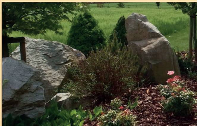
Geoparc a Park (8)

I milovníci geocachingu si zde přijdou na své.