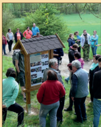
Otevření stezky 2016 (4)

První část naučné stezky byla otevřena v roce 2016, další v letech 2017-18. V jejím budování se bude pokračovat. Byla zřízena Obcí Bory v rámci projektů Místní agentury 21 s podporou Kraje Vysočina a s velikou a obětavou pomocí soukromého dáorce. Panely o kamenolomu jsou darem firmy COLAS CZ a.s.