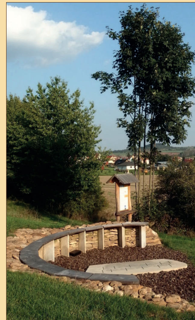
Analematické sluneční hodiny (10)