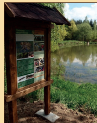
Pohoda u rybníka (15)