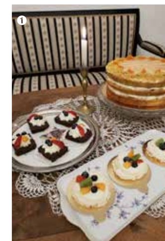
1/ Stylová kavárna Kovářova Kobyla je zároveň kulturním centrem.

kvalitnějších lokálních surovin a podle tradiční receptury, jejíž stopu najdeme na Horácku už ve 14. století, je zde připravují v malé rodinné pekárně. Perníčky ve tvarech srdce, ptáčků nebo třeba květin zdobí tradiční vzory horácké krajky z kvalitního marcipánu. Název dostaly podle nedalekých skalních útvarů Milovské Perníčky , které, stejně jako přírodní rezervace Čtyři palice nebo stará sklářská huť, stojí za návštěvu. Ve Sněžném vyrábí malá rodinná firma Dobručky z Vysočiny další