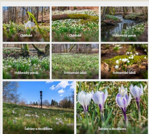
Nyklovický potok: tiché údolí plné květů

Podobně působivou atmosféru nabízí také údolí Nyklovického potoka. Toto místo patří mezi méně známé jarní lokality, o to příjemnější je jeho klid. Na jaře podél potoka rozkvétají tisíce bledulí, které vytvářejí jemné bílé koberce. Stezka vede lesem a kolem vody a nabízí ideální prostor pro klidnou procházku. Šumění potoka, vůně vlhké půdy, zpěv ptáků a první jarní květy vytvářejí atmosféru, která je typická pro probouzející se Vysočinu.