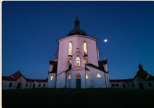
Zelená hora.