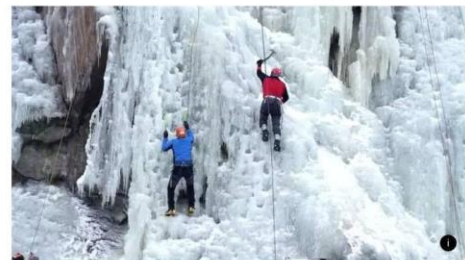
Stěna je ledolezcům otevřená od 13. ledna.

K dispozici jsou tu letošní zimu pro lezce hned dvě skály. „Používáme teď Velkou věž a Malou věž. Velká věž má k vrcholku 42 metrů, leze se do nejšířší části, do 20 až 25 metrů, kde se lezci vejdou vedle sebe a nikoho neohrožují padajícím ledem. Zadní, Malá věž má k vrcholku nějakých 35 metrů, je tam třicetimetrová cesta a další kratší,“ popisuje předseda spolku.