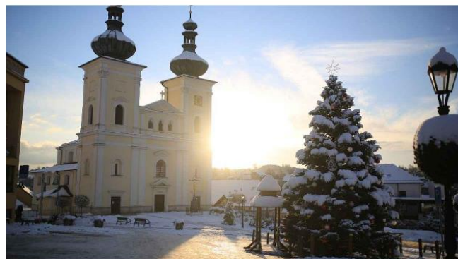
Vánoční Bystřice nad Pernštejnem.

Slavnostně osvětlený traktor u zemědělské školy zpestří advent v Bystřici nad Pernštejnem. Nazdobená technika bude součástí Zubříkova vánočního putování.