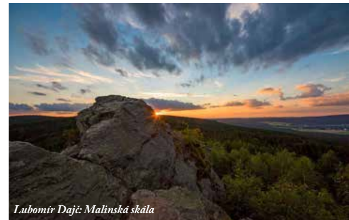
Lubomír Dajč: Malinská skála