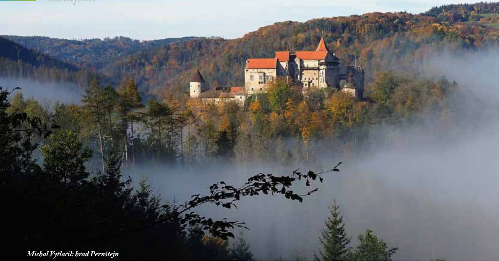
Michal Vytlačil: brad Pernštejn