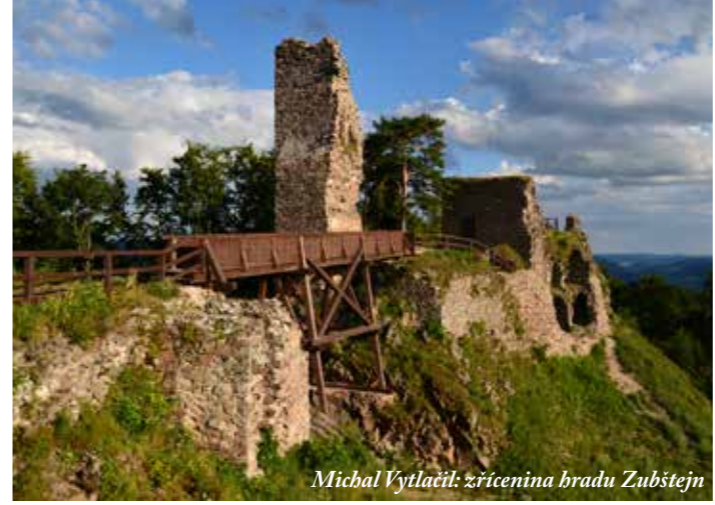
Michal Vytlačil: zřícenina bradu Zubštejn

rozhlednu Horní les až do Dalečína, kde začíná Vodohospodářská naučná stezka. Cestou vašemu pohledu neunikne ani Chudobínská borovice , která svým dojemným příběhem zaujala celou Evropu. Pro opravdové milovníky vyhlídek doporučujeme také