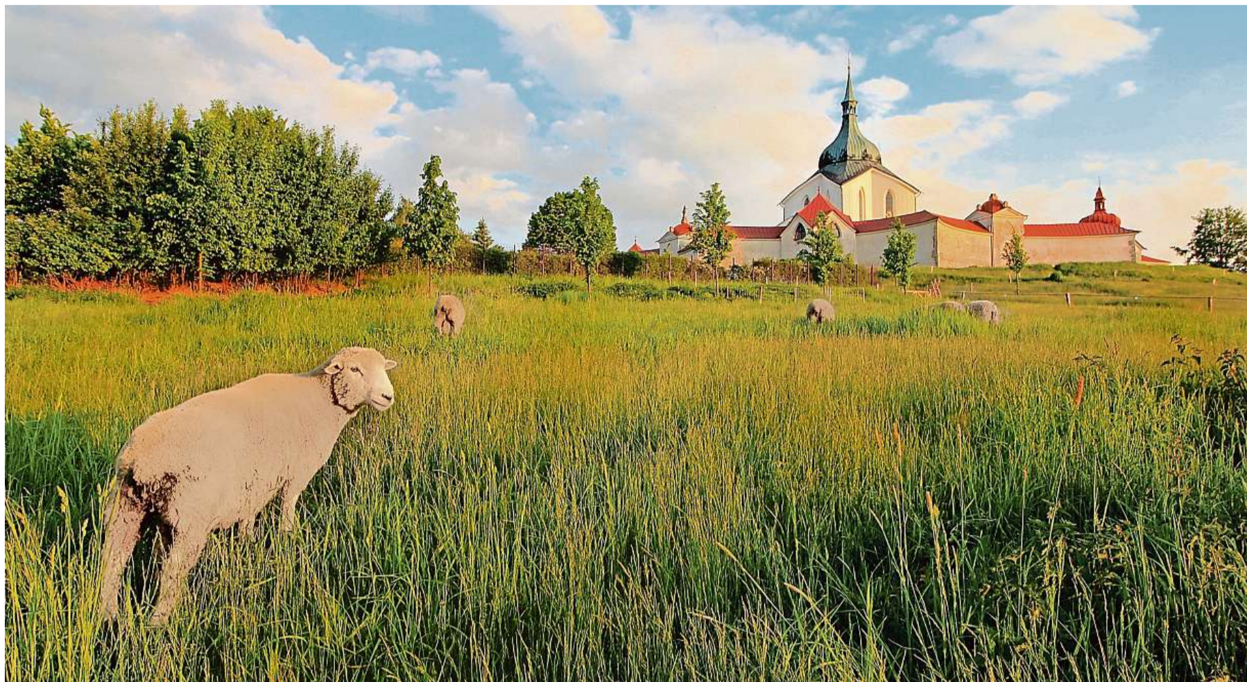
Klenot v krajině Turisté mířící na Zelenou horu se potkávají i s ovceci pasoucími se poblíž památky UNESCO. Za návštěvu stojí také bazilika Nanebevzetí Panny Marie se zrestaurovanými varhanami.

Poutní kostel na Zelené hoře slaví 300. výročí