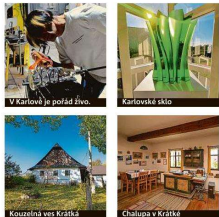
V Karlově je pořád živo.

Původní malé sklárny, které fungovaly na Vysočině v 16., 17. a 18. století, patříly místním bochtickým rodům a mistrům sklářům. Pokud se vydáte po jejich stopách, dostanete se do půvabných vesniček s bohatou architektonickou patřičností do památkově chráněného. Jejich ohně se navíc machy ukládají příroda.