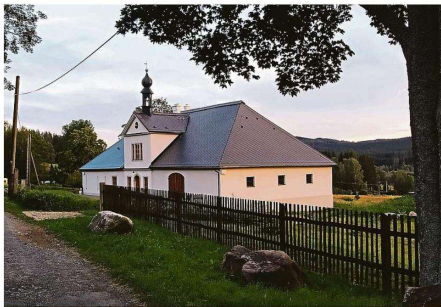
Milovské sklo bylo exportováno do západní a jižní Evropy i do Ameriky a asijských zemí.